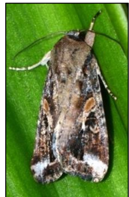
ဖလံအထီး ရုပ်သွင်ပြင်