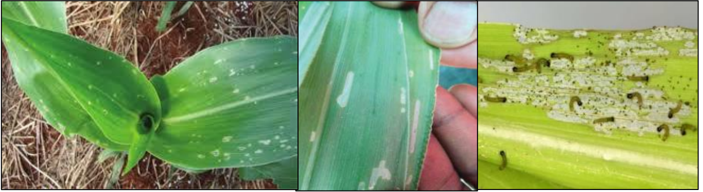
အပ်ပေါက်ရာများ