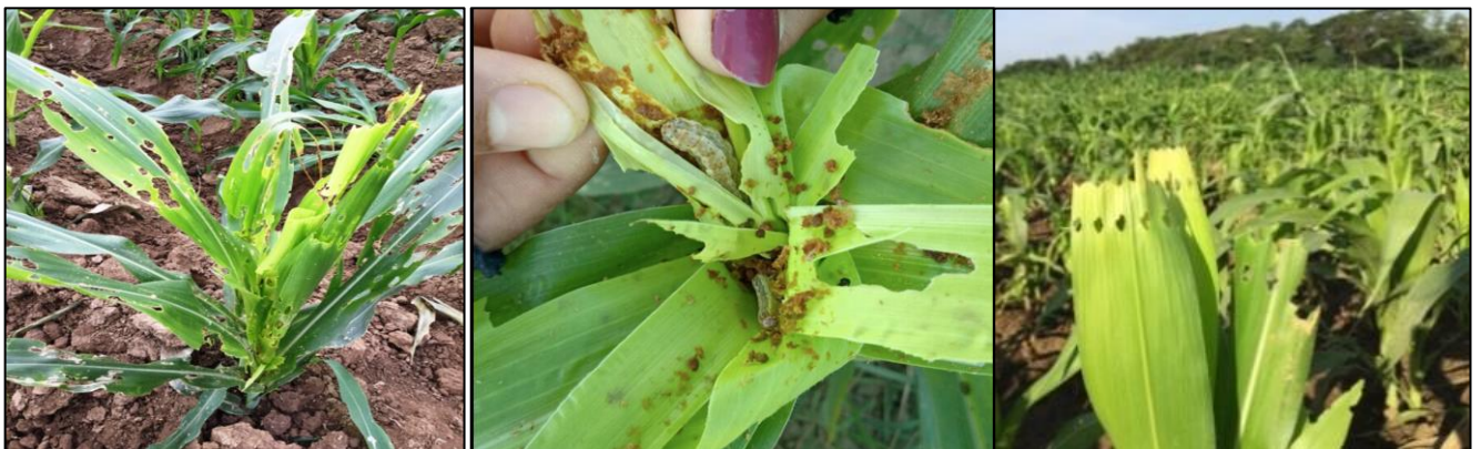
အပင်အတွင်းဝင်ရောက်ဖျက်ဆီးခြင်း လက္ခဏာ

အဆင့် (၄/၅/၆) - အဆင့် (၄)သည်လည်း အရွက်လိပ် အတွင်းဝင်ရောက် စားသောက်သည်။ အဆင့် (၅နှင့်၆)သည်စားအားအလွန်ကောင်းပြီး ပြောင်းပင်၏ အလယ်ညွန့်အောက်ပိုင်းသို့ တိုးဝင်စားသောက်သည်။ အရွက်လိပ်ထဲတွင် မစင်များပိတ်ဆို့ နေတတ်သည်။အပင်ကြီးအဆင့်တွင် အနံ့ဖူးနှင့် ပြောင်းဖူးအတွင်း သို့လည်းဝင်၍ စားသောက်ဖျက်ဆီးသည်။ အစာဝသွား သောလောက်ကောင်များသည်မြေကြီးအနက်(၂-၈)စင်တီမီတာသို့ ဆင်း၍ရုပ်ဖုံးလုပ်ပါသည်။