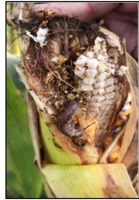
အနံ့ဖူးနှင့် ပြောင်းဖူးအတွင်းသို့ ဝင်၍ စားသောက်ဖျက်ဆီးပုံ